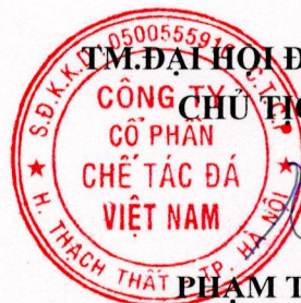
PHẠM TRÍ DŨNG